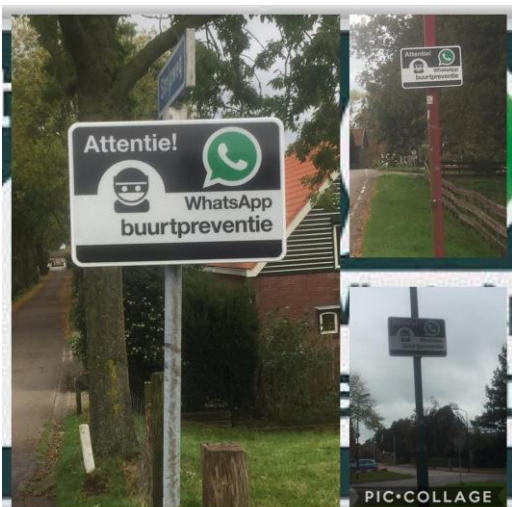
In wijken met minimaal 30% deelnemende wijkbewoners plaatsen wij het buurtpreventie bord

Daarnaast zal Stichting Veilig Houten weer deelnemer zijn op de vaste evenementen zoals de activiteitenmarkt en de veiligheidsdag.