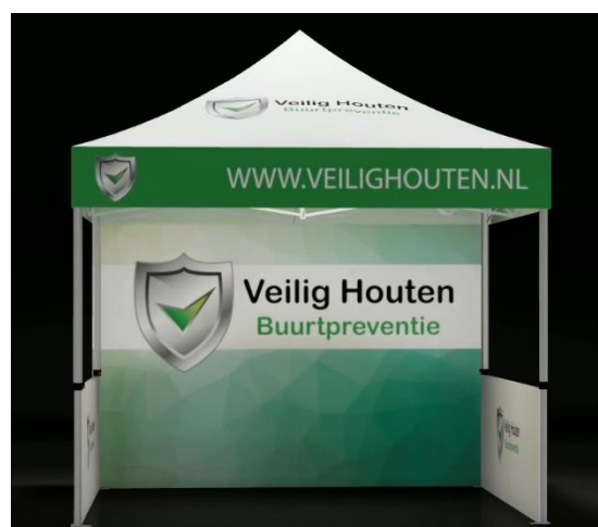
Promotietent Stichting Veilig Houten